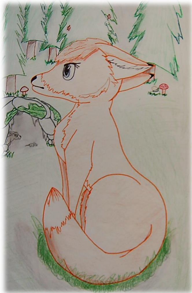
Lisico je narisala Maja Kuhar.