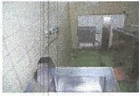
VEČNAMENSKI STROJ, najnižja ponudbena cena 200,00 €