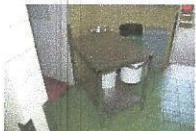
DELOVNA MIZA, 2 kosa, najnižja ponudbena cena 20,00 €/kos