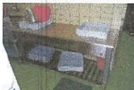
MIZA ODCEJALNA, najnižja ponudbena cena 50,00 €