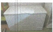
ZAMRZOVALNA SKRINJA FH 401w, LETO 2012, najnižja ponudbena cena 80,00€