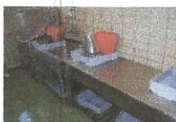
POMIVALNI STROJ S KORITOM, najnižja ponudbena cena 300,00 €