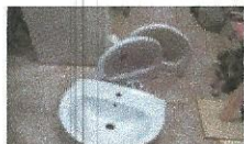
UMIVALNIKI, 3 KOSI, najnižja ponudbena cena 5 €/kos