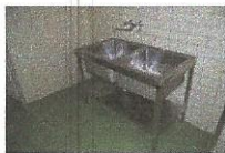
POMIVALNO KORITO, DVOJNO, 2 KOSA, najnižja ponudbena cena 50,00 €/kos