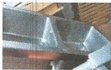
DVOJNO KORITO, 2 KOSA, najnižja ponudbena cena 50,00 €/kos