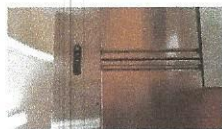
HLADILNA OMARA, najnižja ponudbena cena 250,00 €