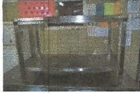
DELOVNA MIZA, najnižja ponudbena cena 30,00 €