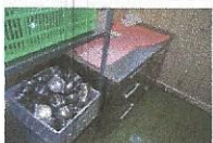
MIZA S ŠESTIMI PREDALI, najnižja ponudbena cena 50,00 €