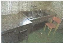
POMIVALNO KORITO Z ODCEJALNIKOM, najnižja ponudbena cena 50,00 €